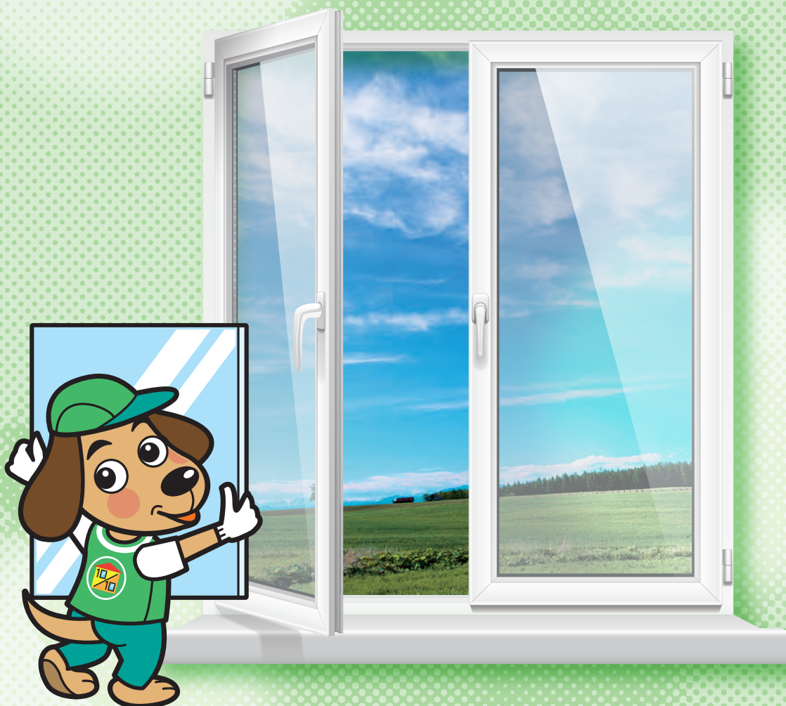
マスコットキャラクターの「TEN犬」です。

（ガラスは透明(トーマイ)で、高機能ガラスは防災安全ガラスやエコガラスに代表されるように2枚のガラス仕様です。「トーマイ&トーマイ」を「10(トー)&10(トー)」と読み替え、10月10日を記念日にいたしました。